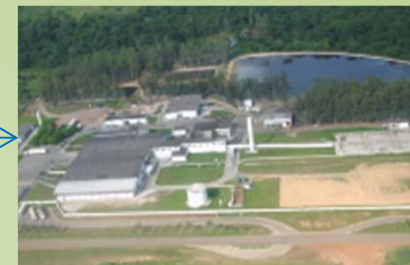
Abates e desossa Controle por fazenda