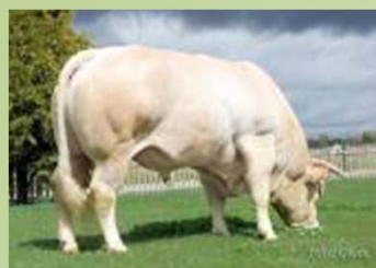
Origem do sêmen Galícia - Espanha