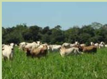
Fazendas Parceiras do GPA (MT, GO e SP)