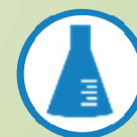
Laboratório Controle de Maciez